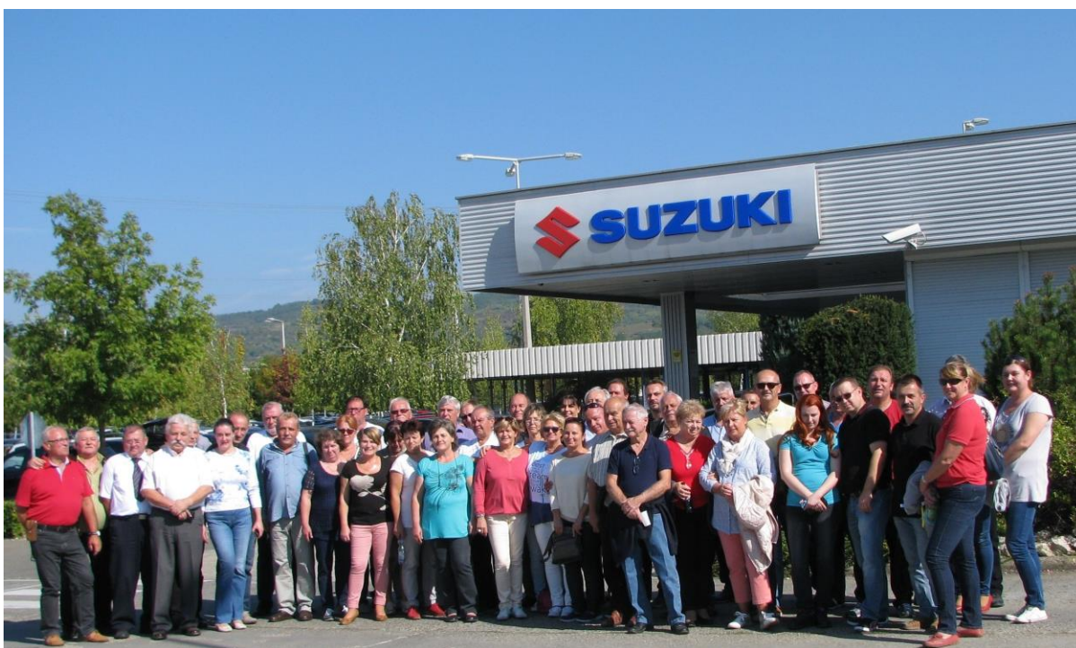
Magyar Suzuki Zrt. Gyárlátogatás, Esztergom

Sajnos a Gyár területén nem lehet fényképezni, de így is emlékezetes marad sokak számára.