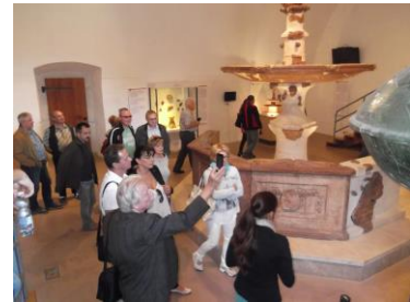
A Szakmai Tanulmányút első állomása a visegrádi Királyi Palota

Még aznap délelőtt a gyönyörű panorámát nyújtó visegrádi Felleg-vár és a nagyon lenyűgöző - a Felleg-várban berendezett - Panoptikumot látogatta meg csoportunk. Mindehhez szerencsénkre, csodálatos kirándulásra alkalmas idő és verőfényes napsütés volt, ami nagyon kellemessé tette az egész programot, és mindenki élvezhette a Dunakanyar gyönyörű panorámáját.