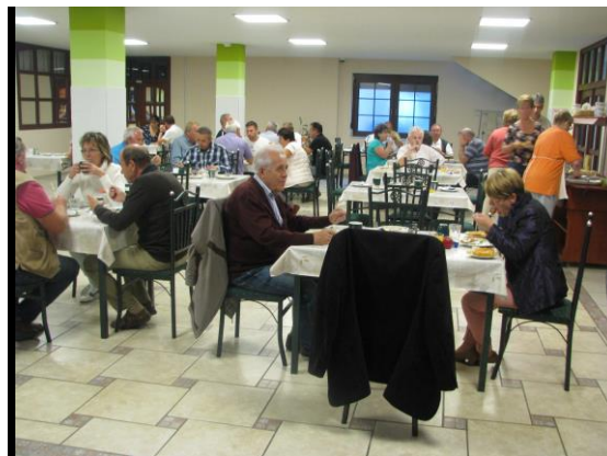
Róza***Hotel és Apartmanház biztosította az esti pihenést

A Szakmai Tanulmányút második napjának helyszíne, szakmai utunk fő állomása a 25 éves esztergomi Magyar Suzuki Zrt. autógyár látogatása volt.