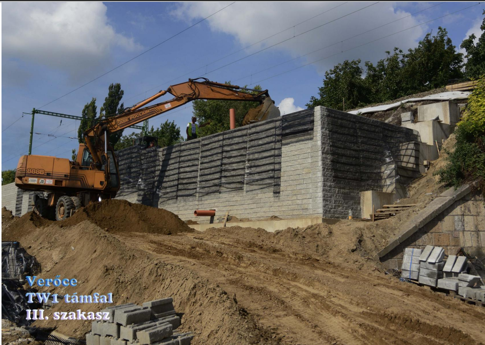
Verőce TW1 támfal III. szakasz