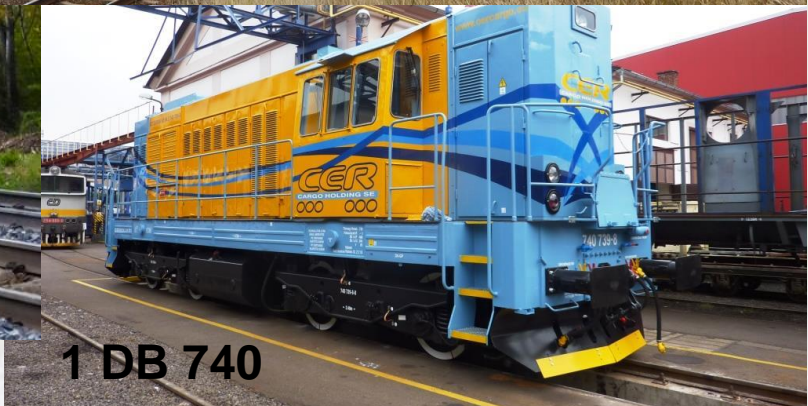
1 DB 740