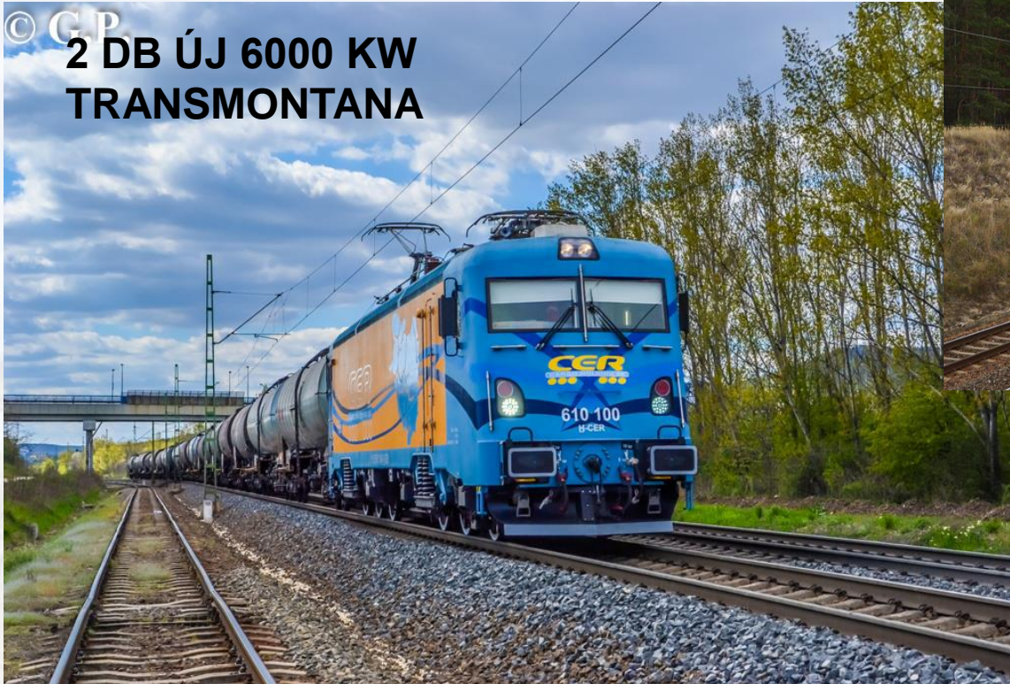
© GP 2 DB ÚJ 6000 KW TRANSMONTANA