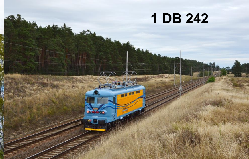
1 DB 242