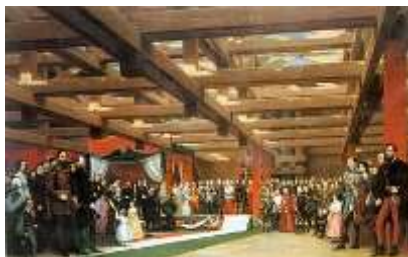
8. A Lánchíd alapkövetétele (Barabás Miklós festménye, 1864)

1866. június 23-án halt meg Budán Clark Ádám skót mérnök, a Széchenyi Lánchíd építésének vezetője és a budai váralagút tervezője. (született 1811. augusztus 14-én a skóciai Edinburgh városában).