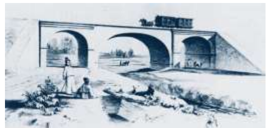
1. Robog a lóvasút Pozsonyból Nagyszombatba. (litográfia)

1846. június 1-jén indult meg a forgalom a Pozsonyt Nagyszombattal összekötő lóvasúton. A vonal 64,5 km. hosszan épült meg, annak figyelembe vételével, hogy alkalmas legyen a későbbi gőzvasút átengedésére is. Személyszállításnál óránként 16 km volt a sebesség, teherszállításnál ennek a fele.