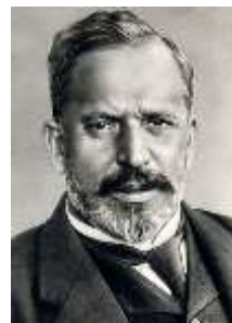
7. Bánki Donát

1859. június 6-án született Bakonybánkban Bánki Donát gépészmérnök, feltaláló, az MTA levelező tagja. A MÁV Gépgyárban és a Ganz gyárban dolgozott, 1899-től a Műszaki egyetemen tanított. Csonka Jánossal elkészítette a nemzetközi piacon is versenyképes Ganz motort, majd annak fontos újítását, az 1893-ban szabadalmaztatott karburátort. Az 1890-es években figyelme fokozatosan a vízgépek felé terelődött. 1917-ben szabadalmaztatta a Bánki-turbinát. (+1922. augusztus 1. Budapest).