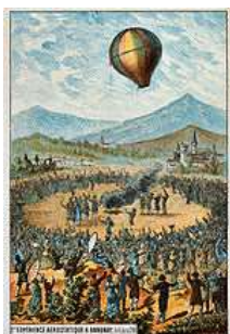
5. Az első nyilvános bemutató Annonayban

1783. június 5-én emelkedett a levegőbe az első léggömb, amelyet a francia Montgolfier testvérek készítettek. Az első út során elővigyázatosságból csak állatokat tettek fel a járműre. A sikeres próbálkozások eredményeként a két testvért XVI. Lajos király nemesi címmel tüntette ki.