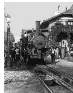
3. A fogaskerekű városmajori állomása 1896-ban

1945. június 16-tól közlekedett újra a háborús pusztítás után a svábhegyi fogaskerekű