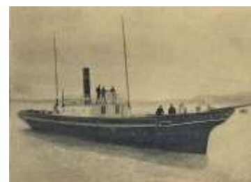
4. Próbaúton a „Helka” minden bizonnyal 1891-ben

1891. június 28-án új szakaszába lépett a balatoni hajózás. Ettől a naptól kezdve a tó egészére kiterjedt a hajóforgalom. Erre a célra három hajó állt rendelkezésre: „Baross” kerekcsászáros (készült Hartmann József hajógyárában 1889-ben), „Helka” és a „Kelén” csavargőzösök (készültek a Schoenichen gyárban, 1891-ben). A Balaton turisztikai fejlődését mutatja, hogy ekkor már naponta háromszor indultak hajók.