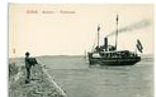
A Helka hajó

kerekcsés gőzös, a "Helka" és a "Kelén" csavargőzösök álltak rendelkezésre e cél megvalósítására.