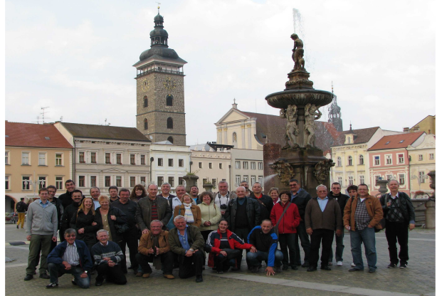
Česke Budějovice csoportkép

Az út első állomása Česke Budějovice belvárosa, mely műemléki védetség alatt van. A főtér érdekessége, hogy mind a négy oldala egyforma hosszú, és a teret határoló lábas házak alatt végig árkád van. Így esős időben is körbe lehet sétálni úgy a teret, hogy nem ázunk bőrig, de szerencsénkre az időjárás végig kegyes volt hozzánk, eső nem esett egyik napon sem.