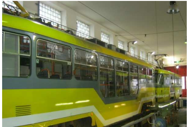
Skoda járműgyár (villamosok)

Mivel Plzeň a sör városa, legtermészetesebb dolog, hogy a Sörgyárat és a Sörmúzeumot beiktattuk a délutáni programunkba. Az első serfőző mesterek valamikor a XIV. század legelején kezdték el áldásos tevékenységüket, de azt tudnunk kell, hogy akkoriban minden háztulajdonos főzhetett saját sört. A város történelmi központjában található sörmúzeum Plzeň sörtörténetét mutatja be a korai évektől egészen máig, majd hétszáz évet felölelve. Ebben a környezetben fogyasztottuk el a cseh konyhának hagyományos ételeiből álló menüsört, amiből nem maradhatott ki a helyben főzött „fekete” sör sem. A múzeumlátogatás, mindenki számára nagy élményt nyújtott, a pincében sok ezer hektoliter szüretlen sörből is kaptunk kóstolót. Mindenki fáradtan fogyasztotta el vacsoráját a Hotel Victoria éttermében, és gyűjtött erőt a következő napi program „teljesítéséhez”. A túrának ekkor jött csak a java.