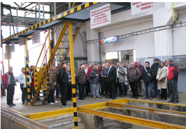
PMDP remiz javítóbázis

Utunk második napi programja a Szakmai Tanulmányút betervezett főállomásai látogatásáról szólt. Reggel a plzeňi Közlekedési Vállalatnál (PMDP) voltunk üzemlátogatáson, elsősorban a villamosok érdekelték a társaságot, mivel a Miskolc Város Közlekedési Zrt. is hasonló villamosokat fog forgalomba helyezni, melyekből már két szerelvény próbaüzemét végzi. Amit megtudtunk az üzemlátogatáson, hogy a plzeňi villamos már a múlt században is létezett. A szocialista rendszer idején fokozatosan elég jól kiépültek a vonalak, különösen északon éri el (egymáshoz közel) a város és a lakótelep szélét az 1-es és a 4-es vonal. A 2-es szintén jól föltár nyugaton egy nagy panelrengeteget, de keleten is a város külső részén van a végállomása. Ehhez közel ér véget az 1-es vonal déli ága, a két végpont között, természetesen mindkét irányba bekötvé, helyezkedik el a Slovany remíz , amit mi is meglátogattunk. Az ötven kilométeres villamoshálózat viszi el a város tömegközlekedésének 45 százalékát. Tervek vannak újabb vonalak építésére is, azonban jelenleg inkább a járműpark modernizálásán van a hangsúly.