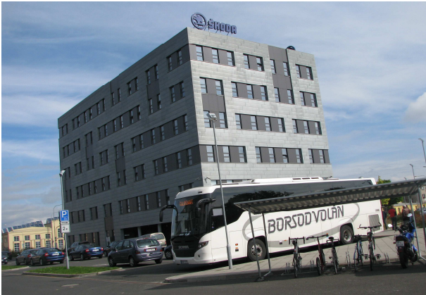
Skoda járműgyár (központi irodaház)