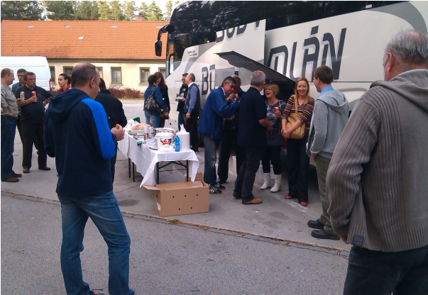
Neu Nagelberg piknik ebéd