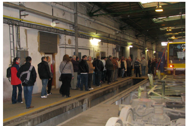
PMDP remiz üzemlátogatás

A Škoda említésével már közelítünk a közlekedés témájához, ha a személyautók nem is itt, de az erőművi berendezéseken kívül a vasúti járművek, villamosok, trolibuszok a gépipari konglomerátum itteni egységeiben készülnek. A Škoda Holding gépipari cégcsoport több vállalata működik a városban, de a vasúti járműveket előállító Škoda Transportation s.r.o. meglátogatása volt utunk elsődleges célja. Amit tudnunk kell, a mai Škoda Holding elődjét, a Škoda Műveket ( Škodovy závody ) 1869-ben alapította Emil Škoda cseh mérnök, miután megvásárolta a Waldstein család által létrehozott kis gépgyárat.