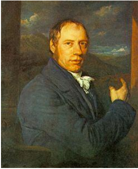
Richard Trevithick 1771-1833

1804. február 21-én mutatta be használat közben Richard Trevithick a világ első vaspályán futó gőzmozdonyát. Próbaútaján 10 tonna vasat, 70 utast és 5 üres vagonot szállított. A 14,5 km távolságot a walesi Penydarren és Abercynon között 4 óra 5 perc alatt tette meg. Mivel a korabeli öntöttvas sínek nem bírták a gőzmozdony 7 tonnás tömegét, a mozdonyból egyszerű gőzgép lett. Későbbi kísérletei is kudarcot vallottak. Dél-Amerikában is dolgozott majd hazatérése után Angliában nincstelenül halt meg.