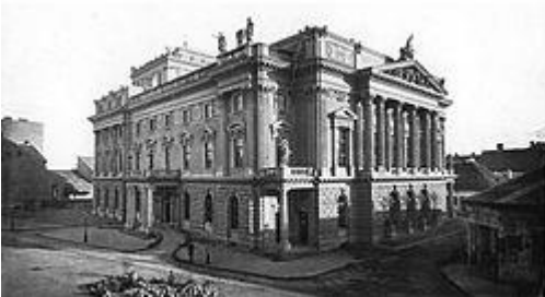
A régi Népszínház a Blaha Lujza téren

1970. április 2-án indult a forgalom a budapesti metró Deák tér – Őrs vezér tere közötti szakaszán. A siker azonban veszteséggel is járt: a Blaha Lujza téren lévő Nemzeti Színházat fel kellett robbantani, az alagút és az aluljáró építése miatt.