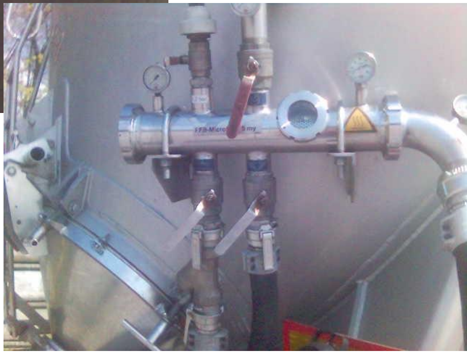
Bioetanol üzem látogatás Komáromban (Rossi)